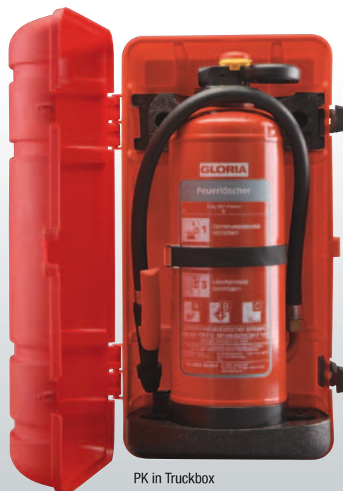
PK in Truckbox