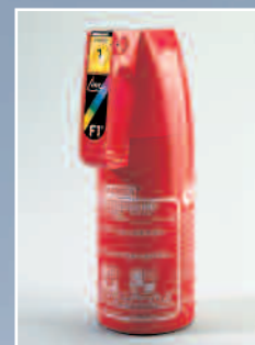
F 1 G