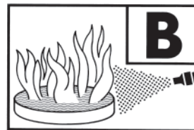
89 B = Typ F 2 GM