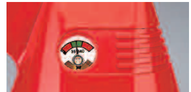
Abb. 1 Kfz-Halter mit Spannband (F 2 G / F 2 GM / F 1 G)