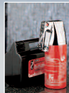
F 1 GM Exklusiv mit Manometer